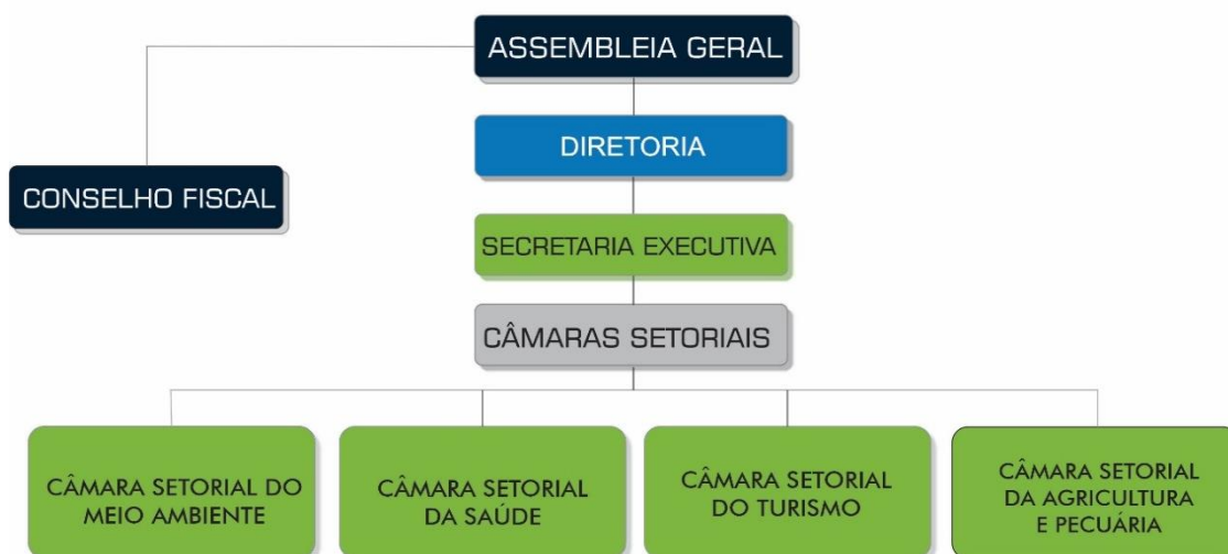
Figura 1 – Organograma da organização do CI/JACUÍ.

O CI/JACUÍ, por ser multifuncional, possui Câmaras Setoriais diretamente subordinadas à Diretoria, tendo por finalidade desenvolver políticas públicas específicas de interesse comum aos entes consorciados. Com esta finalidade o Consórcio possui várias Câmaras Setoriais como da Saúde; da Agricultura e Pecuária; do Meio Ambiente e do Turismo.